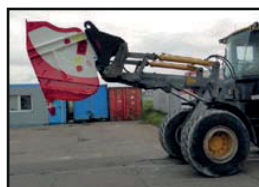
für Radlader / Teleskoplader