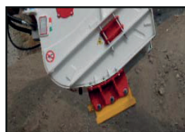
Magnet-Kit + Schalttafel